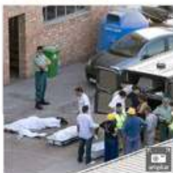
Los equipos funerarios trasladan los cadáveres de los trabajadores fallecidos.

Muere un trabajador de un campo de golf de Marbella al caer por un desnivel de 4 metros